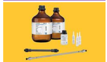
HPLC & HPLC Solvent