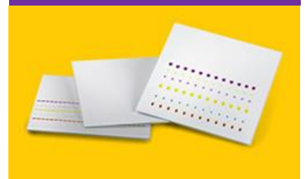
TLC & HPTLC Plates