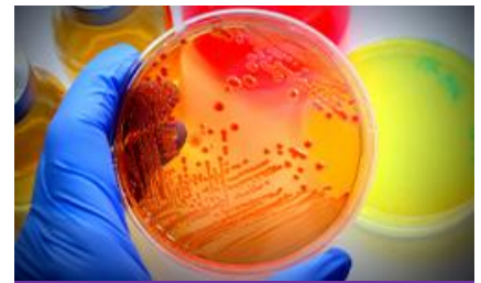
Microbiology Culture Media