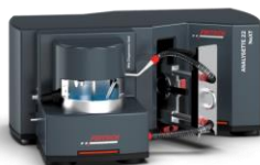
ANALYSETTE 22 NEXT MICRO