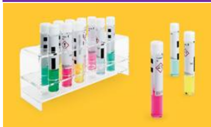
Spectroquant® Test Kits