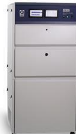
Q-SUN Xenon Arc Test Chambers