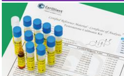
ISO/IEC 17025 Standards