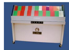
QCT Condensation Tester