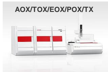
multi X 2500