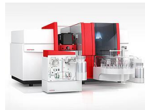
ZEE nit Series