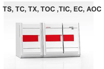
multi EA 4000