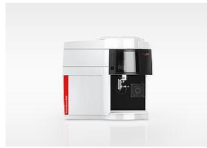
PlasmaQuant 9100 ICP-OES