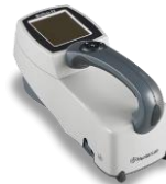
MiniScan EZ 4500