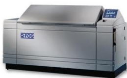
Q-FOG Cyclic Corrosion Testers