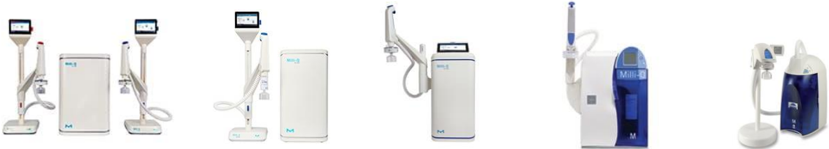
Milli-Q® UV Remote