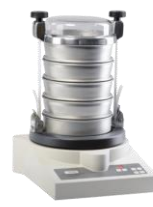
ANALYSETTE 3 SPARTAN