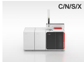
multi EA 5100