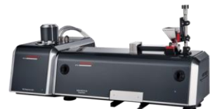
ANALYSETTE 28 IMAGESIZER