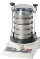
ANALYSETTE 3 PRO