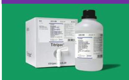
Titripac® Volumetric Sol.