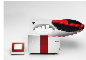
Sample preparation: TOPwave