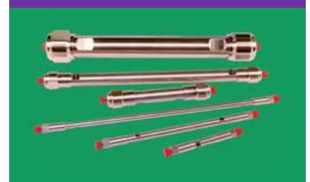
GC & HPLC Columns