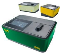
Spectroquant® Prove for Water Analysis