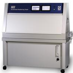
QUV Accelerated Weathering Tester

ผลิตภัณฑ์ Q-LAB จำหน่ายโดย เอแอนด์เอ รีเอเจนท์ ในพื้นที่ภาคใต้ด้วยความร่วมมือกับ บริษัท คัลเลอร์โกลบอล จำกัด ตัวแทนจำหน่ายในประเทศไทย