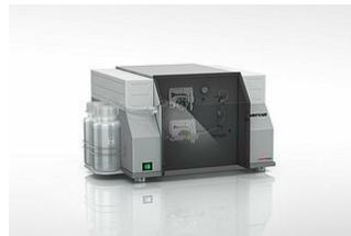
mercur DUO plus